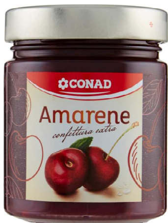
Inserire immagine uno.

i clienti sono invitati a riportare le confezioni in loro possesso presso qualsiasi punto di vendita CONAD